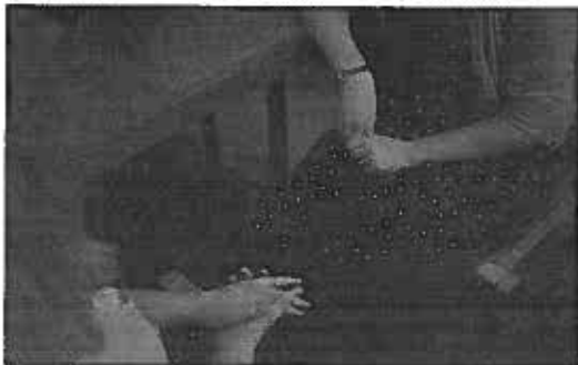
FILOSOFISKE GESTER: Det norske filosofilandslaget og lærerne deres forbereder seg til årets Filosofi-OL ved å diskutere frihetsbegrepet.

nasjonen Frankrike er faktisk ikke med i konkurransen – deltakerne må skrive på et annet språk enn morsmålet sitt, og de er visst ikke gode nok i engelsk.